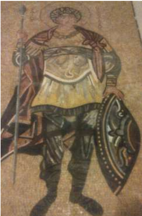
The new St Demetrios mosaic arrived at our church from Lebanon Monday December 23rd