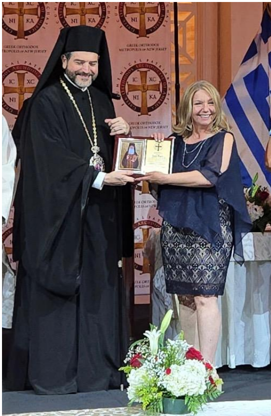
Youth Worker Award

Συγχαρητήρια σε όλους τους άλλους παραλήπτες φέτος!