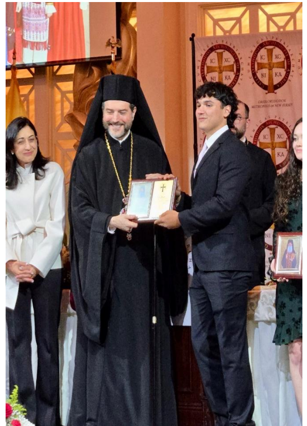
Youth Member Award